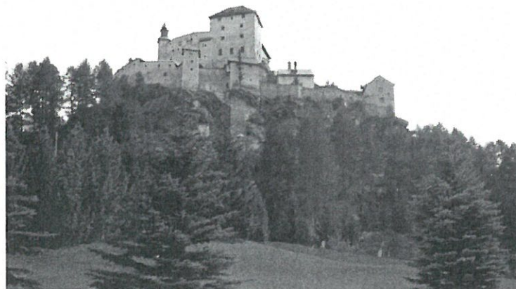
Ab 1907 liess Odol-König Karl-August Lingner die Ruine von Schloss Tarasp wieder aufbauen. Sie stand auf einem kahlen Hügel (oben). Wenige Jahre nach der Aufforstung dokumentierte die Baumschule Stahel ihr Werk in Fotos (unten).